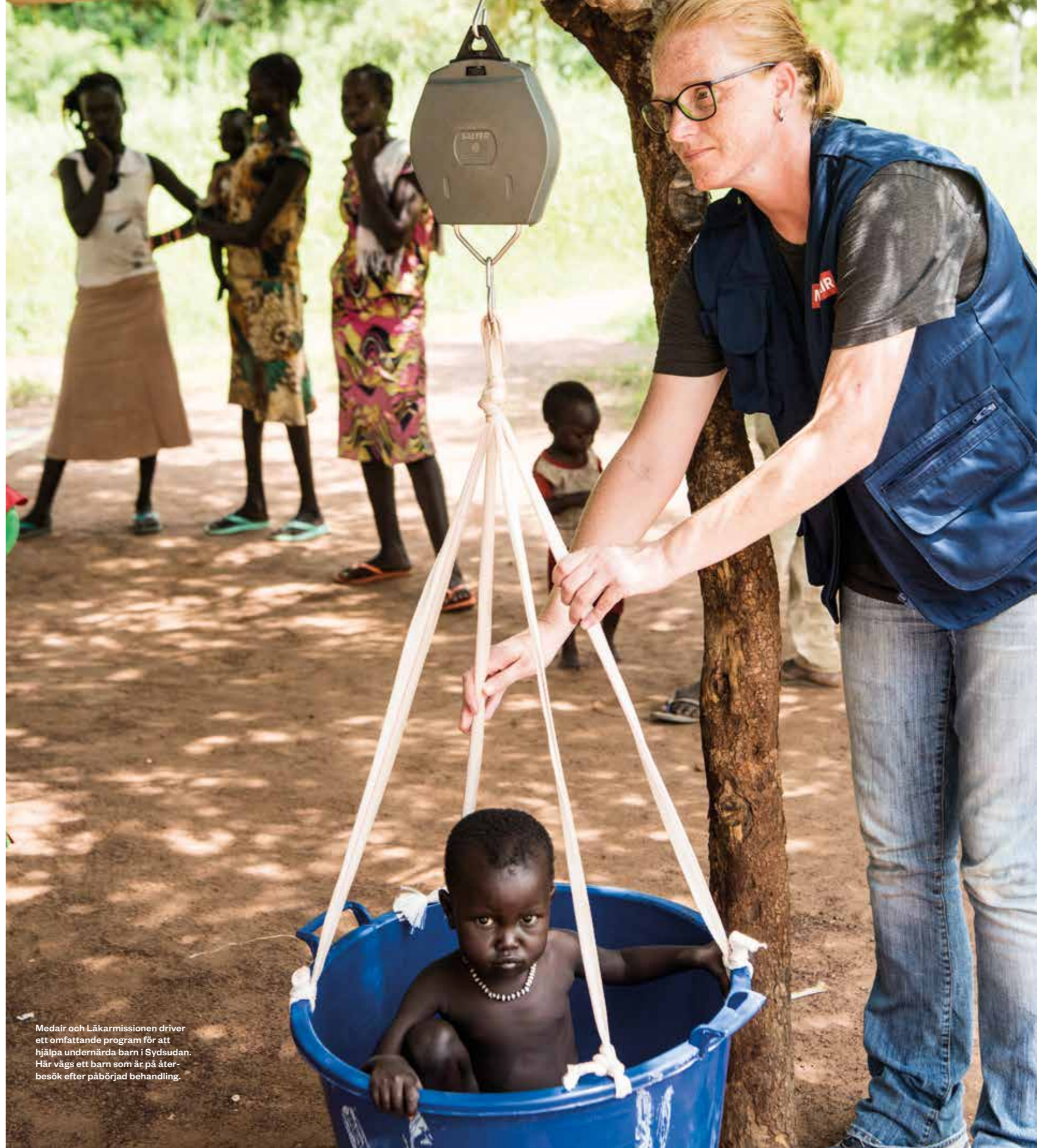
Medair och Läkarmissionen driver ett omfattande program för att hjälpa undernärda barn i Sydsudan. Här vägs ett barn som är på återbesök efter påbörjad behandling.