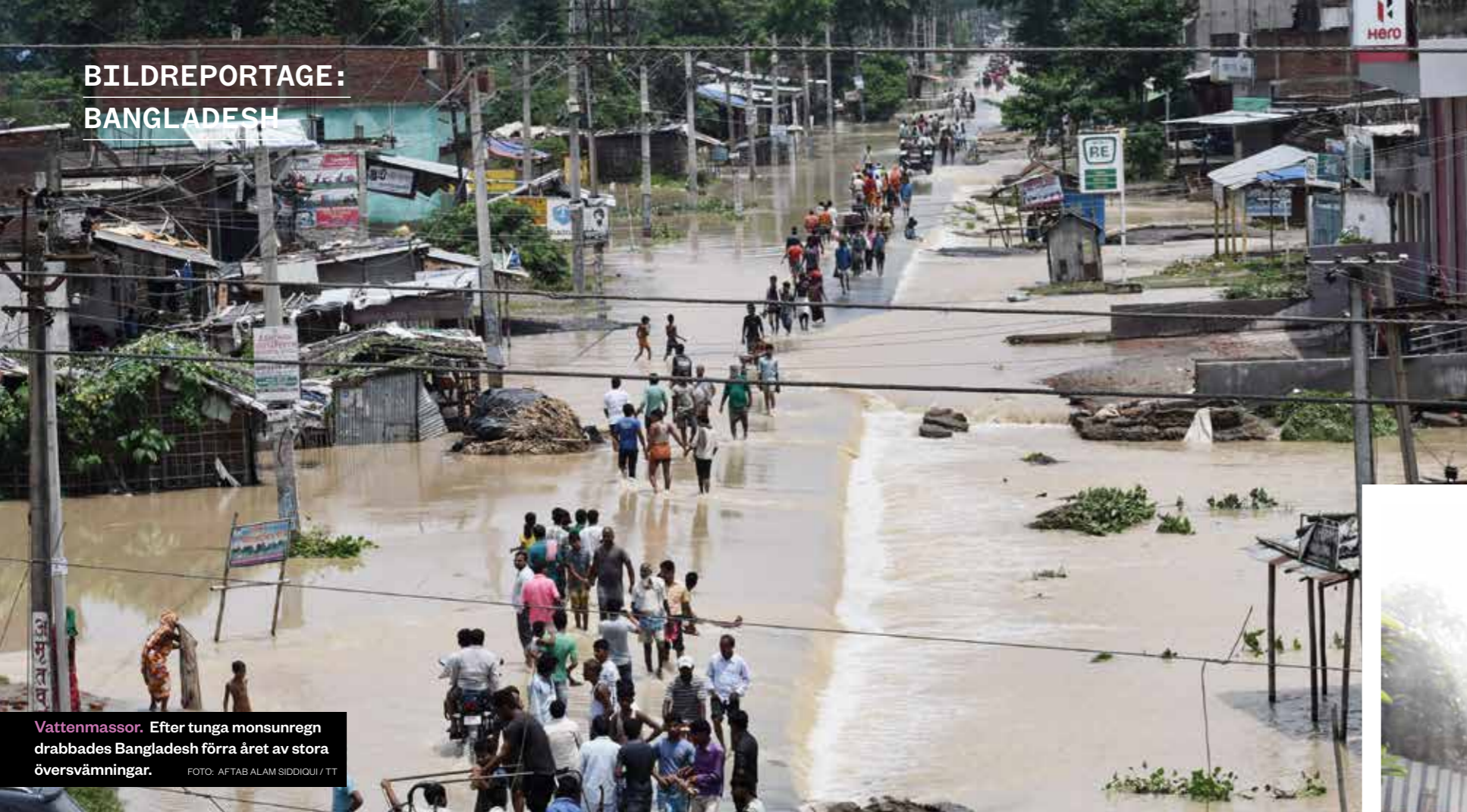
Vattenmassor. Efter tunga monsunregn drabbades Bangladesh förra året av stora översvämningar.