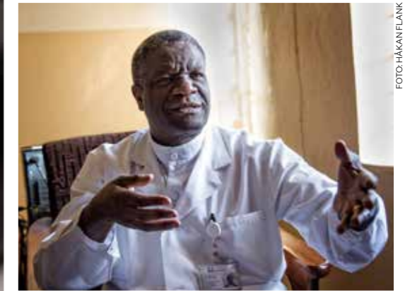
Doktor Mukwege är både gynekolog och pastor i DR Kongo där det är tabu att prata om sex.

DOKTOR MUKWEGE ÄR både gynekolog och pastor i DR Kongo där det är tabu