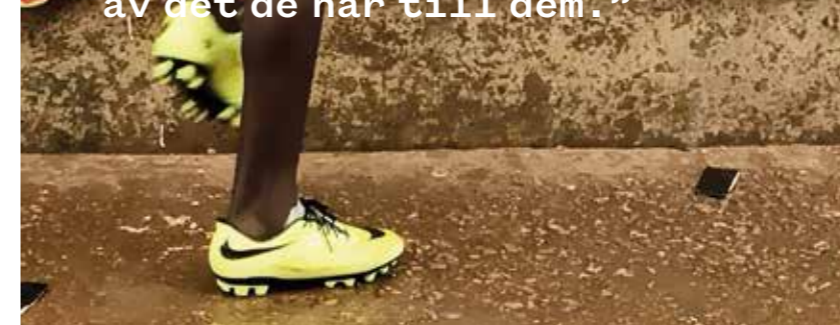
Glädjen var på topp när alla barnen, iförda den nya fotbollsutrustningen, möttes i en match på fotbollsplanen i Kampala.

EN AV KVÄLLARNA följde barnen och deras mammor med Retraks personal på en nattvandring och fick se alla barn som kväll efter kväll kurar ihop sig i gathörnen.