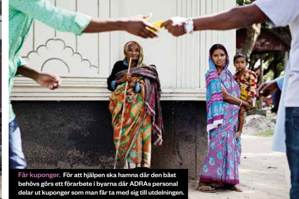
Får kuponger. För att hjälpen ska hamna där den bäst behövs görs ett förarbete i byarna där ADRA:s personal delar ut kuponger som man får ta med sig till utdelningen.