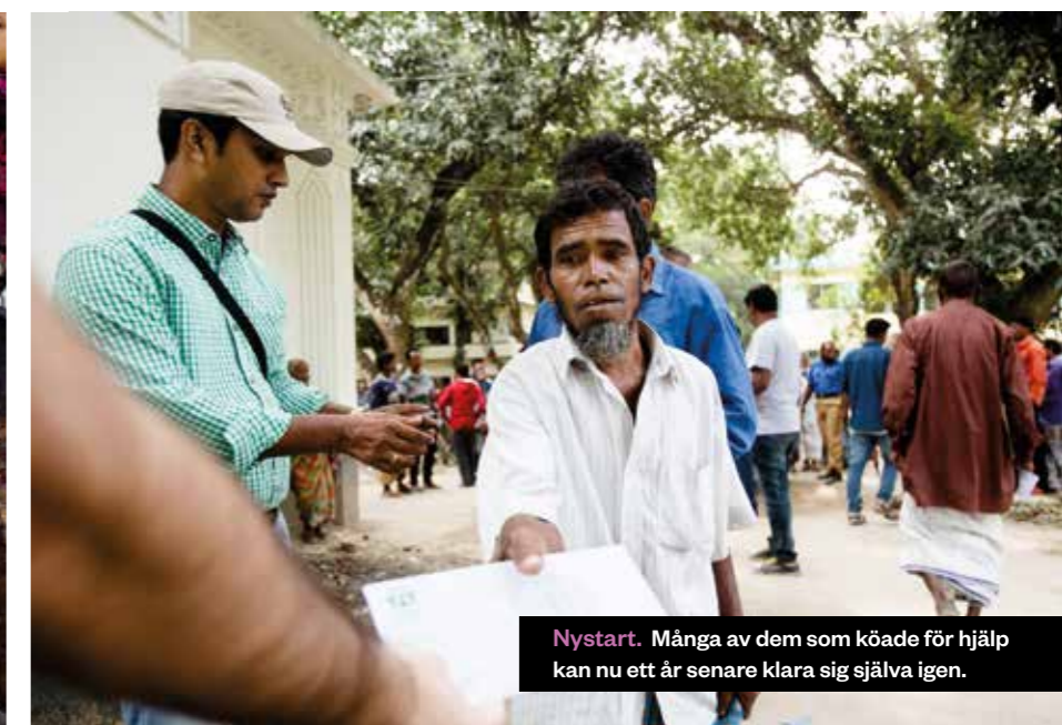
Nystart. Många av dem som köade för hjälp kan nu ett år senare klara sig själva igen.